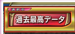
この場合は過去最高データ画面へ移動

カーソルで選択した項目を決定する場合に押します。項目を決定後は選択した画面に移動します。